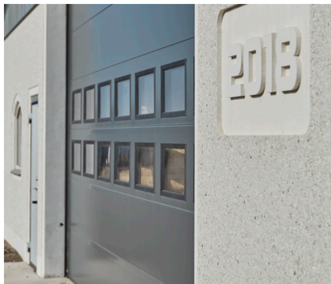
Vit friläggning i vit betong.