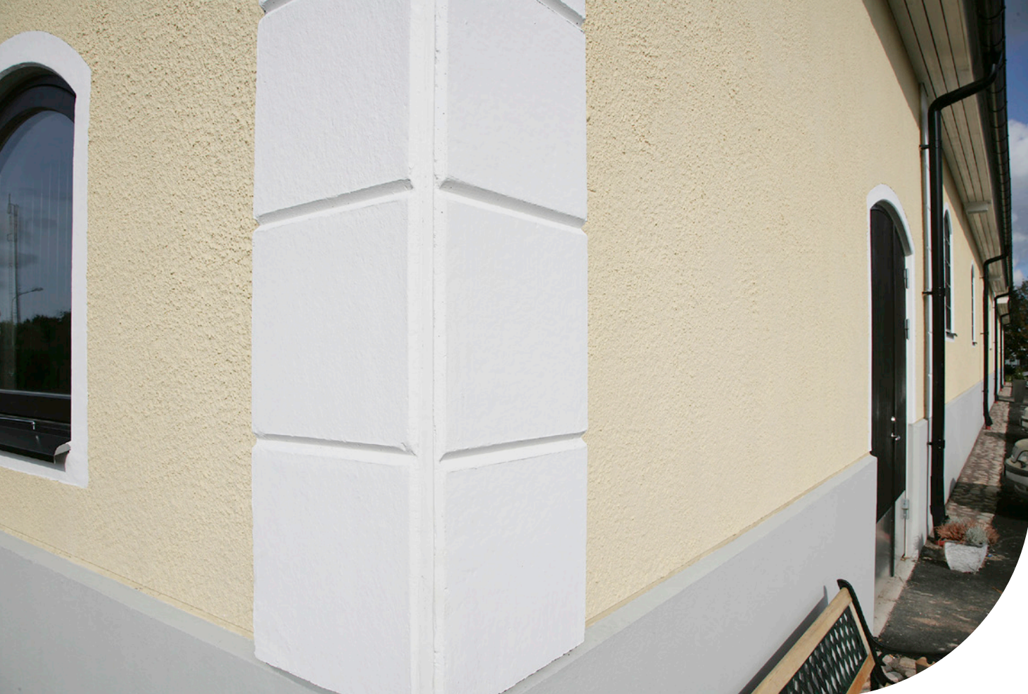
Ströplad yta, gulmålad